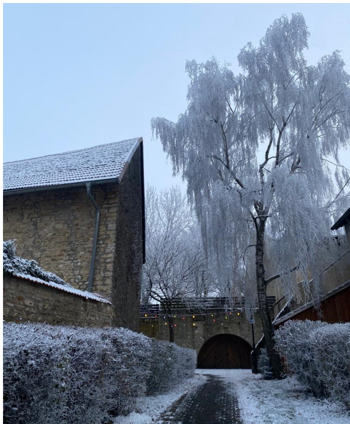
Text und Bilder: SK