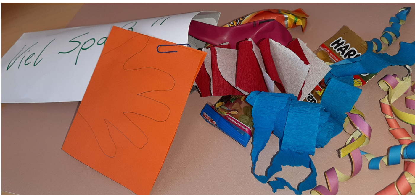
So sah unsere Partytüte aus – Luftschlangen, eine selbstgebastelte Girlande, eine Konfettirakete und Naschereien für die Hausparty