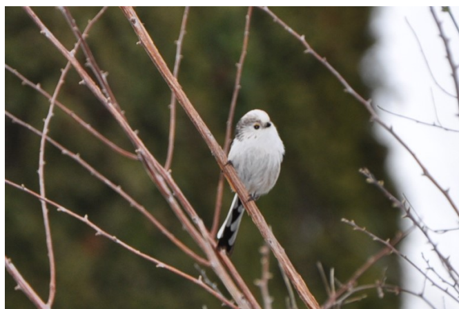
Bilder: Sabine Schwabe

Schwanzmeisen sind sehr soziale Tiere. Außerhalb der Brutzeit leben sie in Schwärmen von 20 bis 30 Tieren. Gemeinsam verteidigen sie ihr Revier gegenüber anderen Schwärmen.